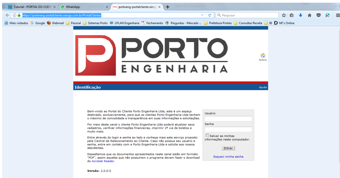
Página inicial do portal do cliente da Porto Engenharia

Para acessar o Portal do Cliente da Porto Engenharia utilize o seu navegador de internet para o endereço/site https://portoeng-portalcliente.sienge.com.br/PortalCliente/